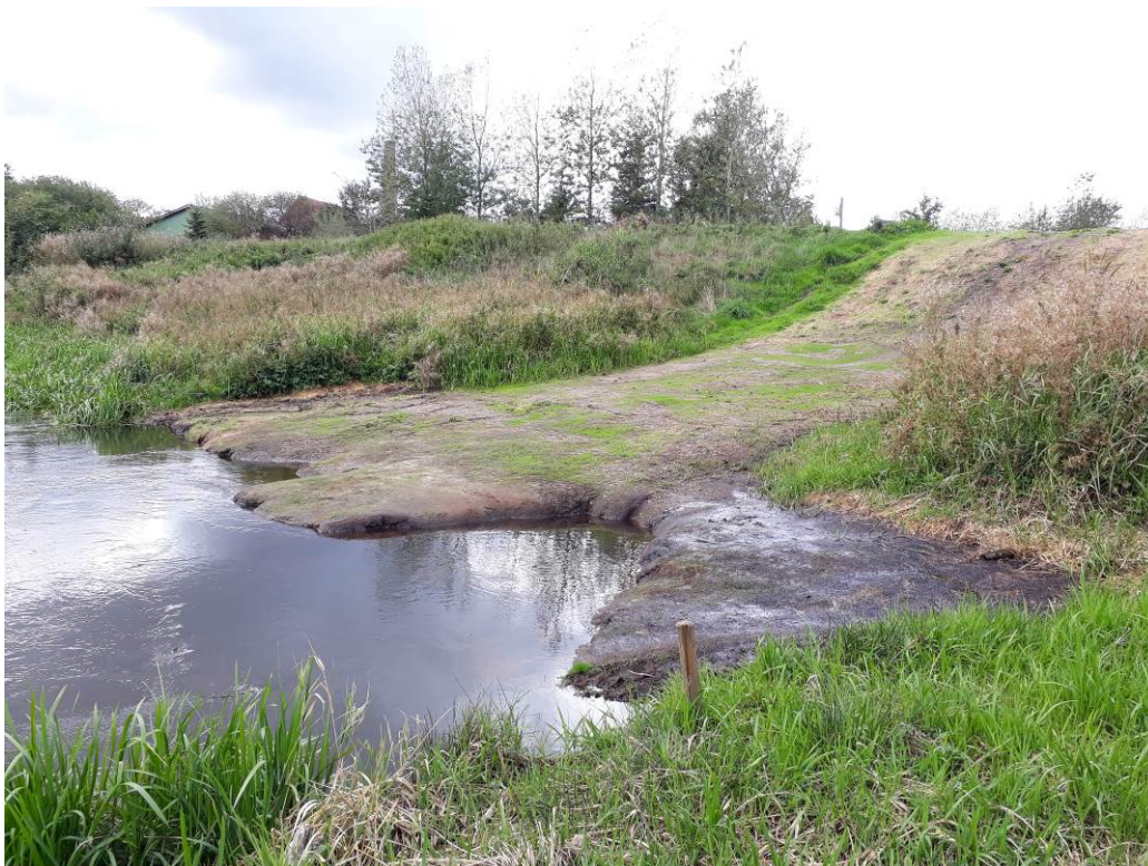
Arealet efter endt brug i september 2018.