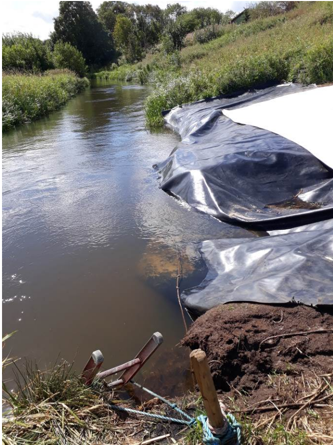
Plastic på å-brink og stige til landgang, august 2018