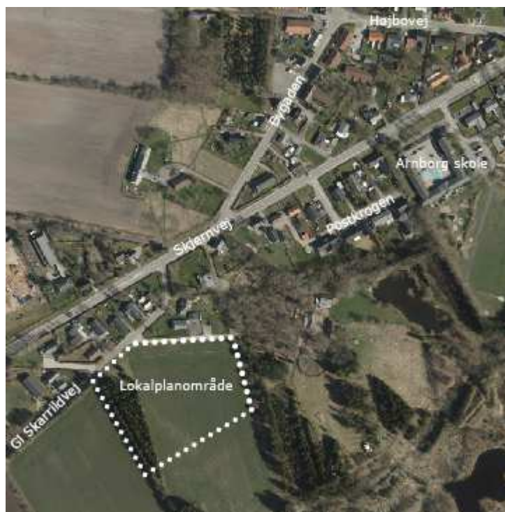
Uddrag af luftfoto over lokalplanområdet fra lokalplan nr. 71.B6.

Baggrunden for dette tillæg er, at alt regnvand fra lokalplanens veje og fælles befæstede arealer, skal håndteres via fælles nedslivningsanlæg, der etableres, drives og vedligeholdes af bolig- og grundejere i lokalplanområdet ved et spildevandslav.