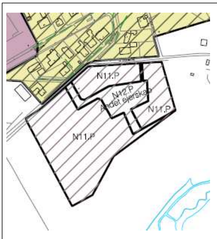
Uddrag af oplandskort for tillæg 6 til Herning Kommunes Spildevandsplan 2015 - 2025