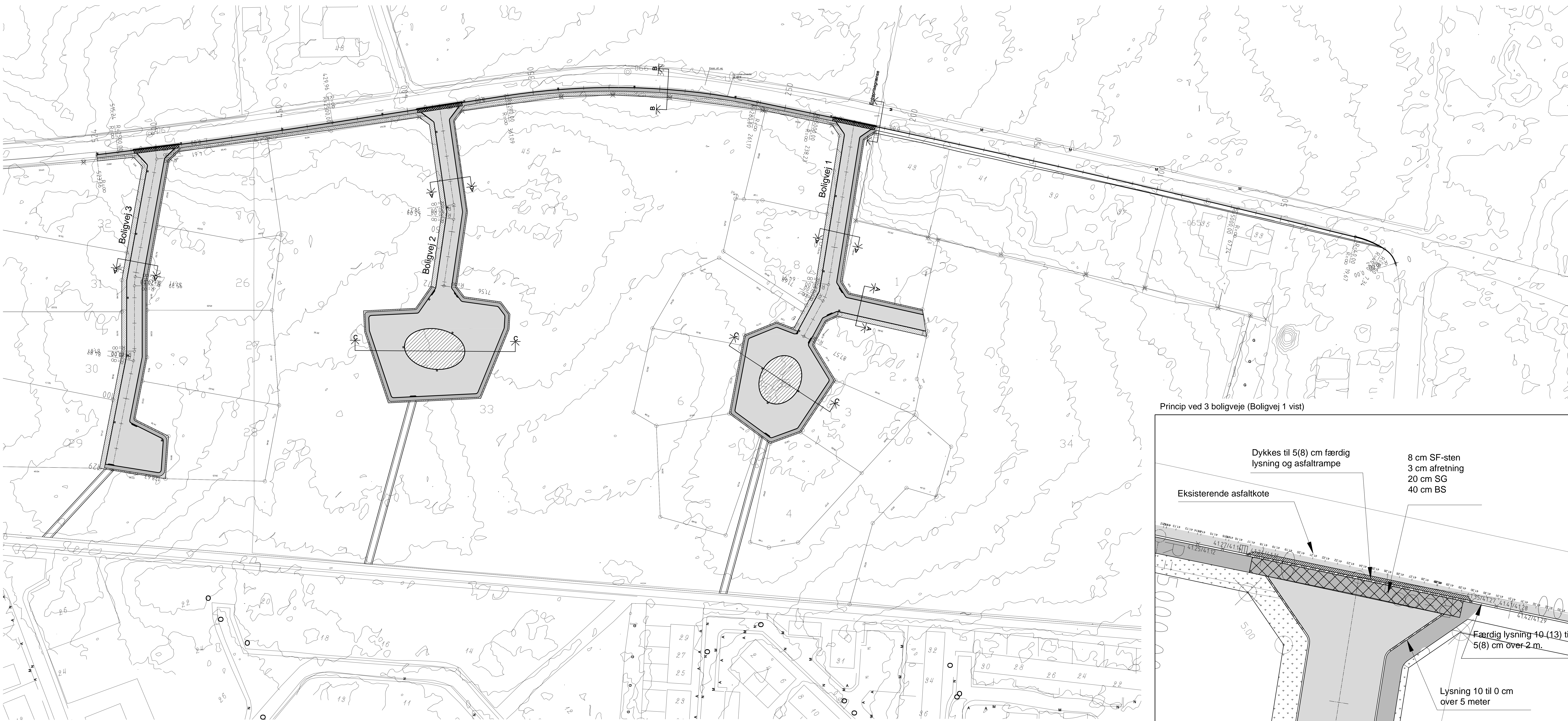
Princip ved 3 boligveje (Boligvej 1 vist)