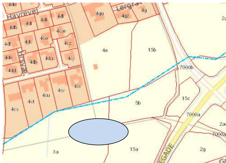
Eksempel på principiel placering af bassin - her henover tre matrikler: 3a, 5b og 15a (tænkt eksempel).

Modellen for arealerhvervelse er som omtalt faseopdelt og de frivillige arealerhvervelser hhv. ekspropriationer bliver ikke nødvendigvis matrikelspecifikke før ca. 6-12 måneder år før bassinet skal anlægges.