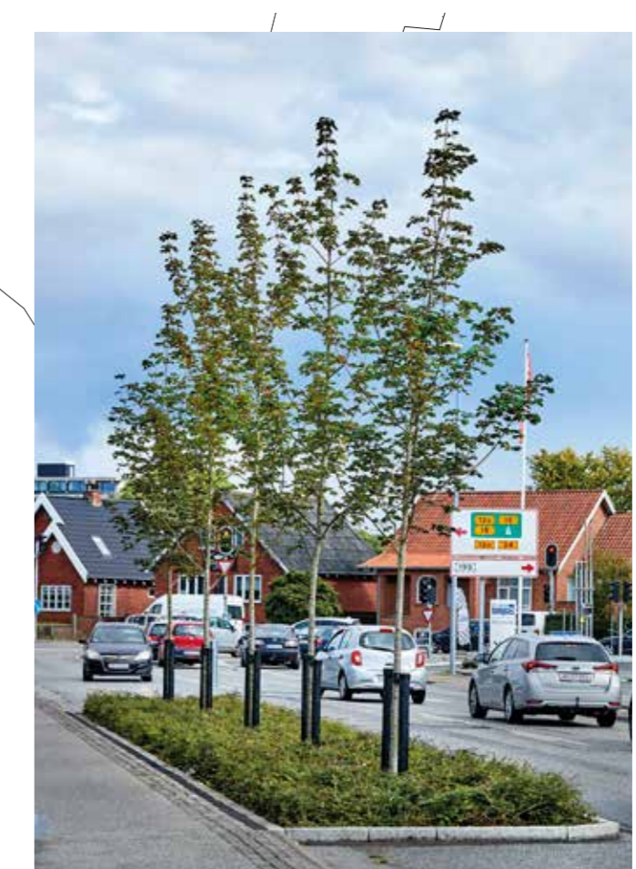
Inspiration fra Viborgvej i Herning. Bedene vil blive skråt afskårne.