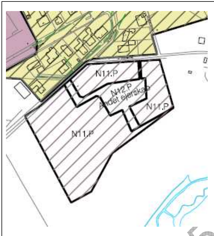
Uddrag af oplandskort for tillæg 6 til Herning Kommunes Spildevandsplan 2015 - 2025