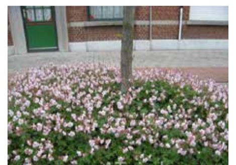
Princip som forskønnelse centralt i hovedgaden

Natur og Grønne områder har udarbejdet ud- viklingsplan for anlægget. Det anbefales at den revideres med henblik på tankerne i Strategi for Smukke indfaldsveje og at her evt. kunne placeres lysprojekt eller kunst i samarbejde med borgerforeningen