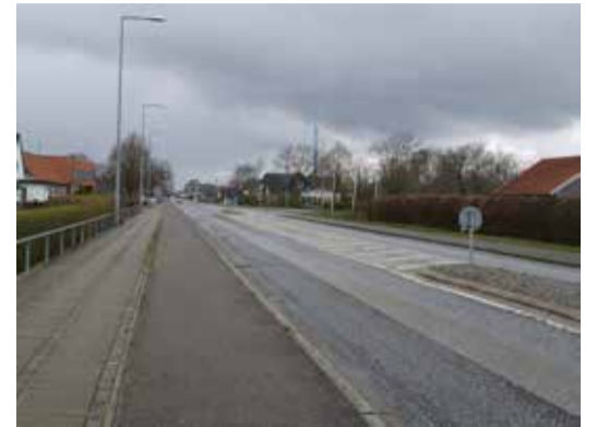
Eksisterende forhold Lind Hovedgade