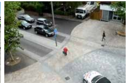
Eksempler på overgange

Overgang for de bløde trafikanter Økonomi - Forskønnelsespuljen