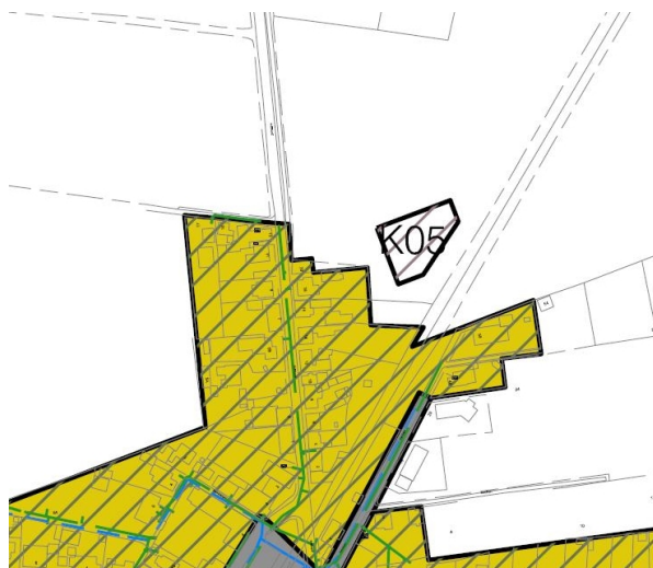
Kommende spildevandsplan for Studsgård

Overfladevand og kondensvand fra varmepumpen skal nedsives på grunden. Der skal nedsives overfladevand fra et samlet befæstet areal på 770 m 2 . Under drift på anlægget, hvor luften nedkøles, vil der dannes kondensat fra varmepumpen, og mængden af kondensvand vil variere fra 0 m 3 /t til 3,6 m 3 /t.