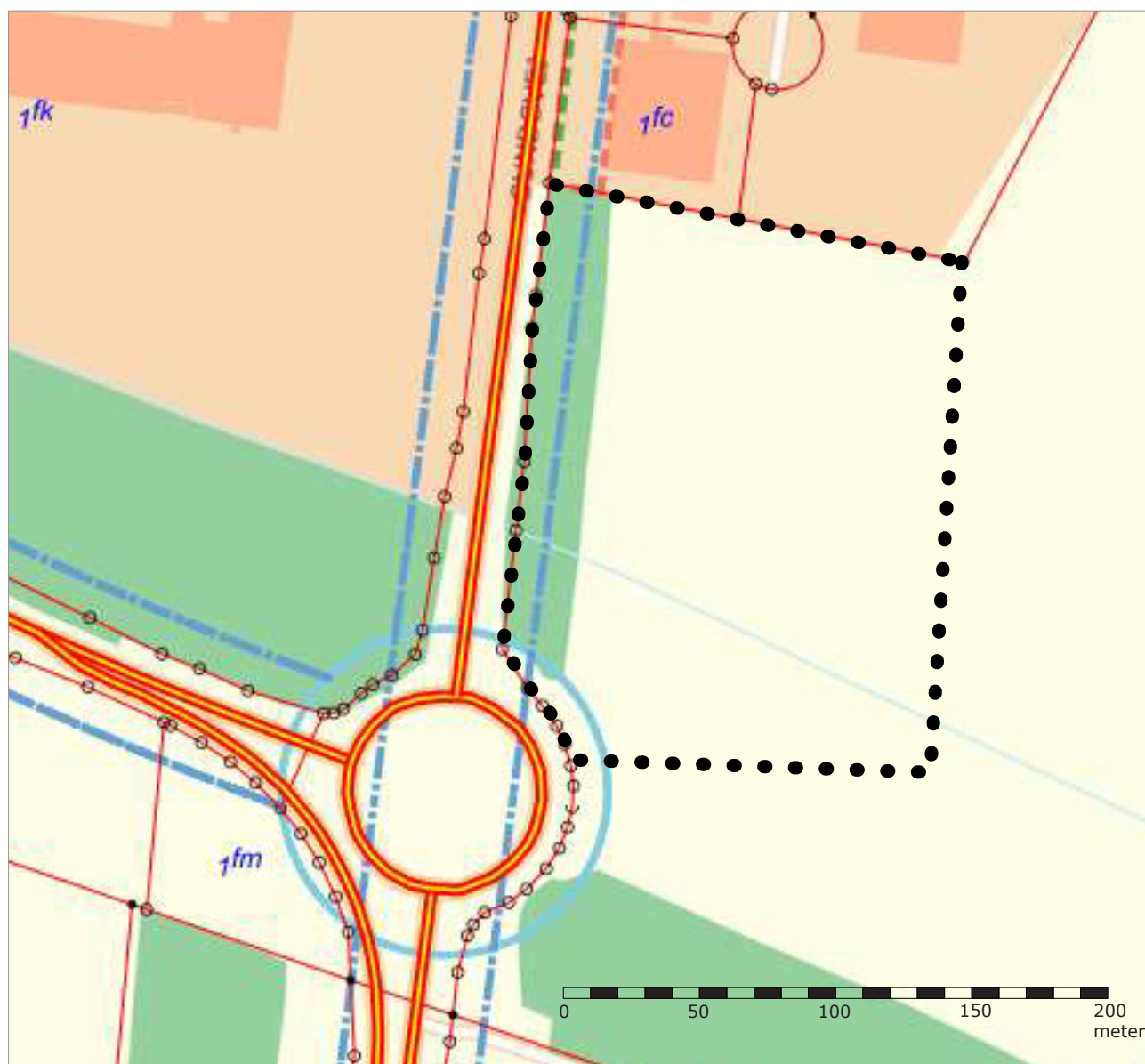
Vejbyggelinjer langs statsvej 430 Viborg-Herning. Vejbyggelinjerne er markeret med lys blå. Lokalplanafgrænsningen er markeret med dottet sort.

Indsigelsen er indsat som Bilag 1 forrest i dette notat.