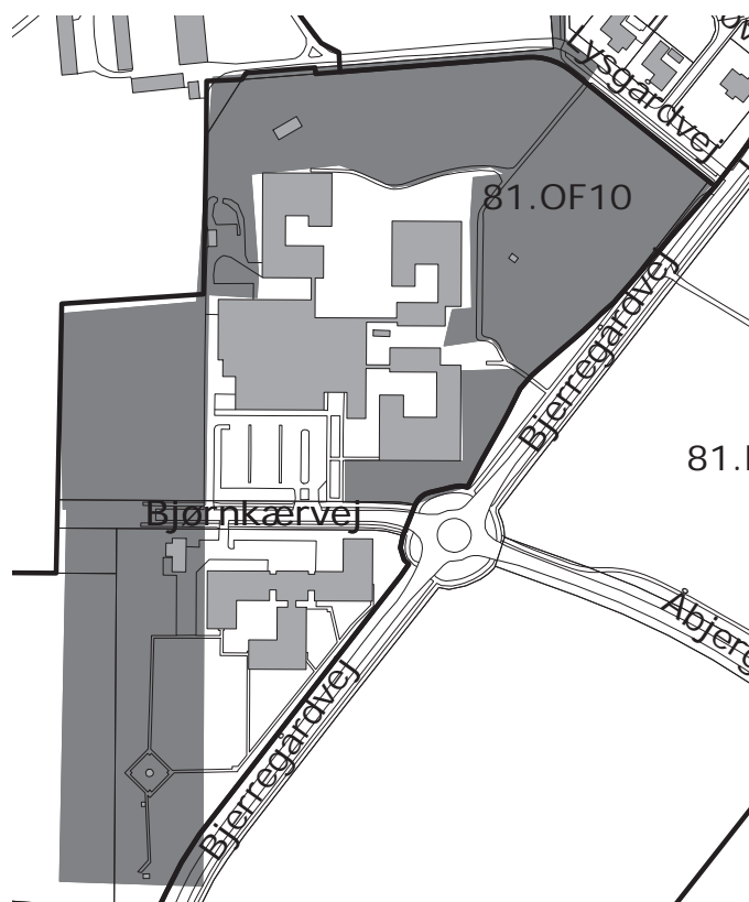
Eksisterende grøn bystruktur

I Herning Kommuneplan 2013-2024 er arealet omkring den eksisterende skolebebyggelse udpeget til at være en del af en grøn bystruktur. Kommuneplantillægget giver mulighed for etablering af institution i området og derfor vil en udpegning af en grøn bystruktur ikke være forenelig med etablering af en ny daginstitution. Derudover reduceres udpegningen af den grønne bystruktur i den sydlige del af rammen omkring det eksisterende plejecenter, så bebyggelse og vejarealer ligger uden for udpegningen. Den ændrede afgrænsning af den grønne bystruktur fremgår af nedenstående kort.