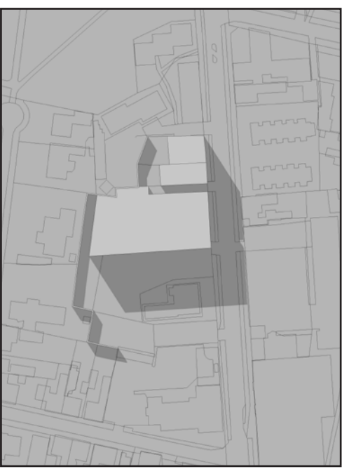
21. MARTS KL 16.00