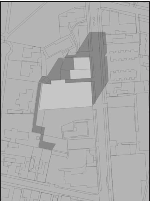
21. MARTS KL 9.00

DER ER MODELLERET BEBYGGELSE I 12 METERS HØJDE I HELE BYGGEFELTETS UDBREDELSE (ABSOLUT MAX. I FORHOLD TIL LOKALPLAN)