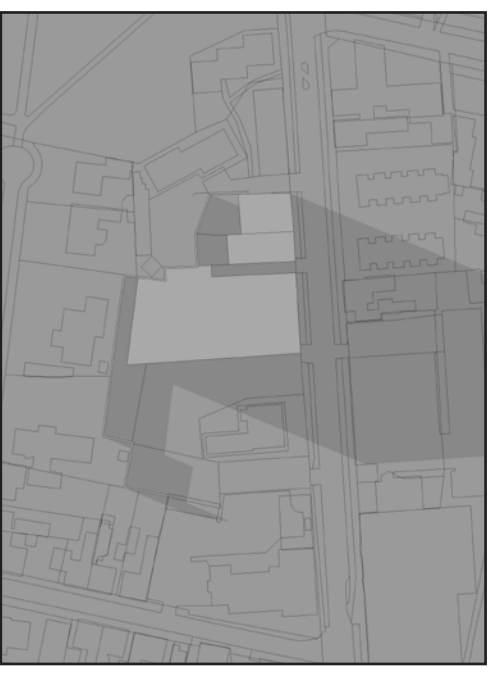
21. DECEMBER KL 14.00