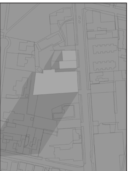
21. JUNI KL 20.00