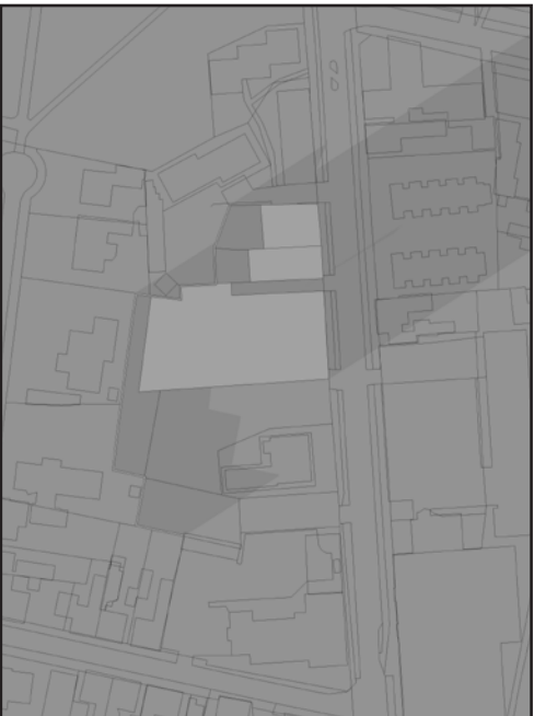
21. DECEMBER KL 10.00