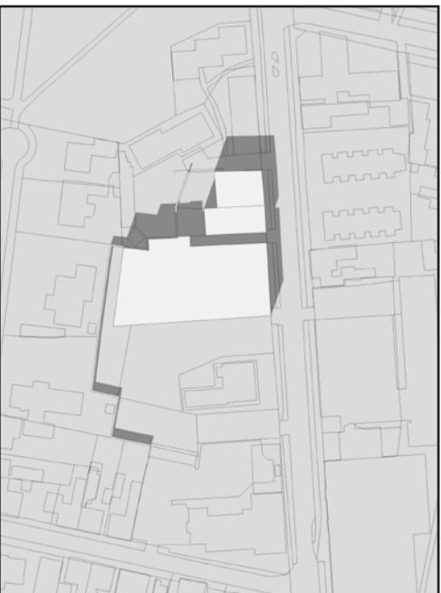
21. JUNI KL 9.00