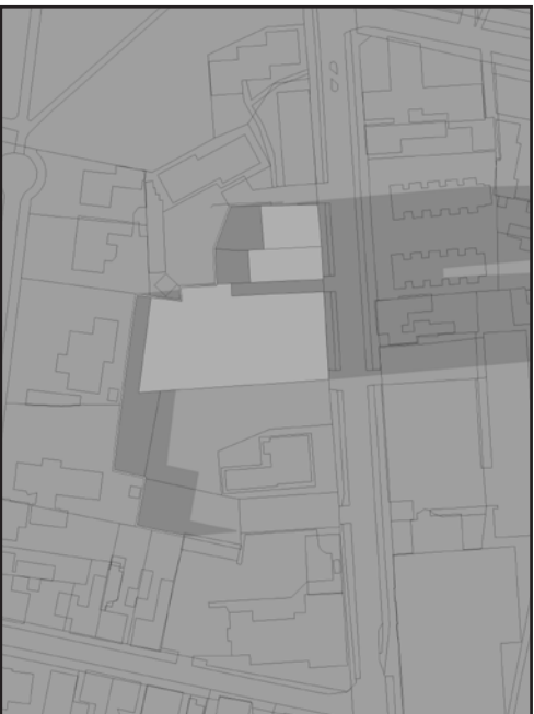
21. DECEMBER KL 12.00