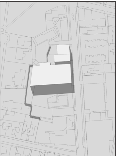
21. JUNI KL 16.00